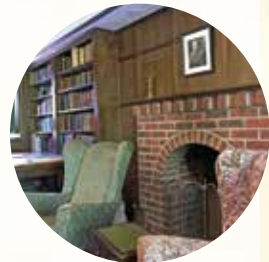
C・S・ルイスハウス