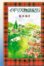
当ツアーの 紀行エッセイ集