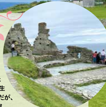
ティンタジェル城

英国南西部コーンウォール地方の海に面した古城。『ブリタニア列王記』ではアーサー王誕生の地とされ、人気観光地。城は13世紀建造だが、近年、アーサー王の5～7世紀の遺跡が発掘。