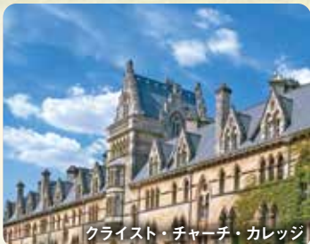
クライスト・チャーチ・カレッジ