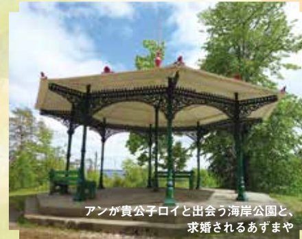
アンが貴公子ロイと出会う海岸公園と、求婚されるあずまや

第3巻『アン愛情』の舞台は、英国的な港町ハリファクス。モンゴメリも20代に暮らしました。アンが愛した古い墓地、アンが通う名門キャンパス、アンとギルバートが散歩する海岸、アンが暮らすパティの家の通りへ。