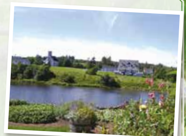
昼食をとるニューグラスゴー