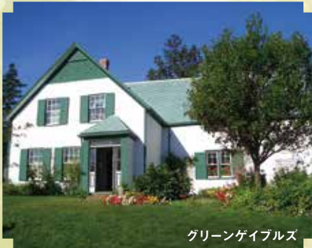
グリーンゲイブルズ

アンが暮らすアヴォンリー村へご案内します。グリーンゲイブルズ、お化けの森、恋人たちの小径、輝く湖水、アンとマシューが出逢う駅舎など、物語の世界とモンゴメリにゆかりの場所をめぐる。