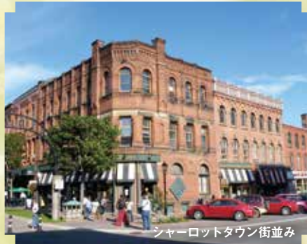
シャーロットタウン街並み

プリンスエドワード島の州都。物語ではアンが進学するクイーン学院のある都会として登場する美しい町です。カナダ建国史跡・州議事堂、19世紀の古風な街並みの散策、ショッピングをお楽しみいただけます。